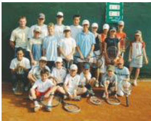
Bild: Sommercamp 2004