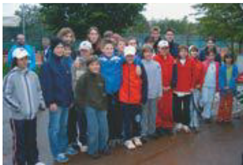
Bild: Jugendvereinsmeisterschaft 2004

Am 25. und 26. September fand dann noch zum Abschluss der Saison unsere Jugendvereinsmeisterschaft statt. Zum ersten Mal wurde in den 4 Gruppen Junioren, Knaben, Mädchen und Bambini gespielt. Trotz des miserablen Wetters und des in München parallel stattfindenden weltbekannten Bierfestes war die Resonanz nicht nur bei den Kindern groß: Zahlreiche Väter und Mütter erschienen gutgelaunt und trugen unter anderem durch viele Kuchen- und Salatspenden zum Gelingen der Veranstaltung bei.